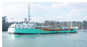
SABLERS DE L'ODET