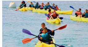
CANÔES SUR L'ODET